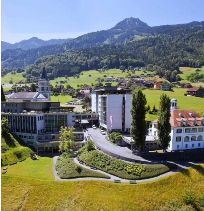
Vista al Centro Neu-Schönstatt