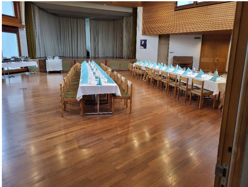
Sala de trabajo (aquí todavía está acondicionada como sala de banquetes)