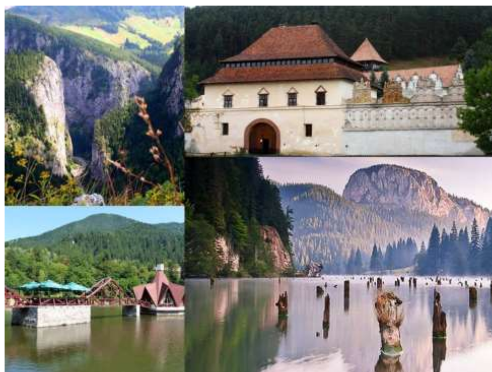
Le gole di Bicz / Békás, il castello di Lăzarea (Gyergyószárhegy) e il lago assassino (Lacul Roșu / Gyilkos-tó)