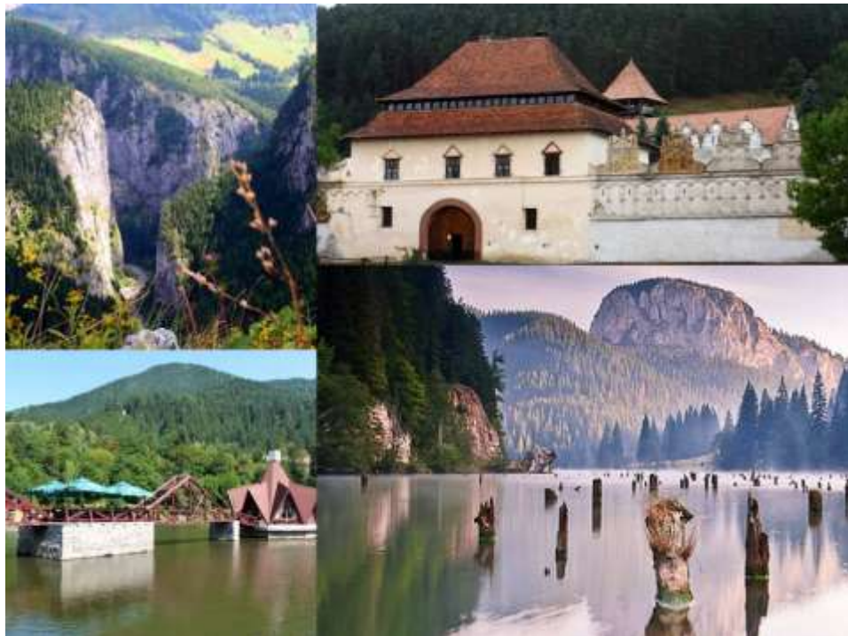
Las gargantas de Bicz / Békás, el castillo de Lăzarea (Gyergyószárhegy) y el lago asesino (Lacul Roșu / Gyilkos-tó)