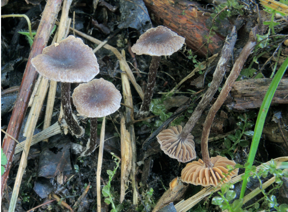
Cortinarius americanus

Lövskogar finns längs sjöar och älvar med Alnus incana , Betula spp., Populus tremulae , och Salix caprea . Särskilt intressanta är fuktiga kärrområden med arter som Cortinarius americanus och andra små svårbestämda Telamonia -arter under Salix .