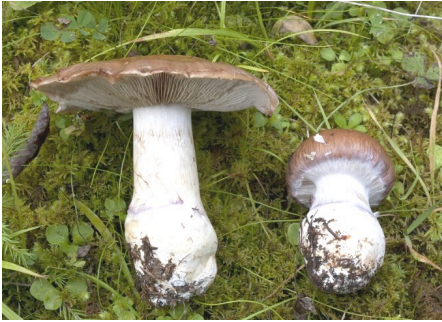
Cortinarius blattoi