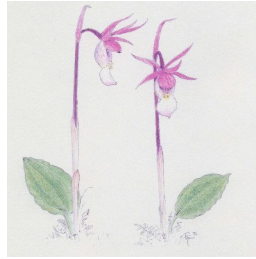
Calypso bulbosa (norna) Akvarell av Rolf Lidberg